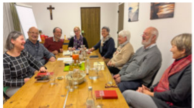
Am ersten Abend begleitete die Gruppe die Sterndeuter.

diesen ökumenischen Abenden waren bisher mit großem Interesse auf der Reise und konnten wertvolle Erfahrungen und Erkenntnisse gewinnen. Die gute Zusammenarbeit von Katholischem und Evangelischem Bildungswerk bereichert die unterschiedlichen Erfahrungen zusätzlich. Die Bibel und ihre Geschichten besser zu verstehen, sind der Hintergrund für diese Runden. - Alois Höfl