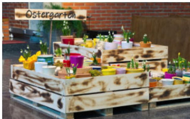
Nach wenigen Tagen erblühte der Ostergarten bereits.