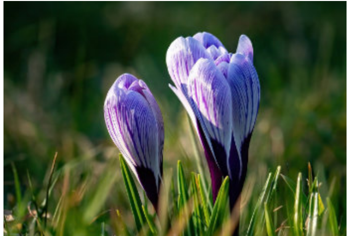
Der Frühling klopft an die Tür.

Wer kennt nicht das Gefühl, wenn die ersten Sonnenstrahlen des Jahres die Haut wärmen? Wenn die Knospen an den Bäumen platzen und die Vögel morgens lauter zwitschern? Da ist diese Energie, diese Aufbruchstimmung, die uns einfach mitreißt. So ähnlich muss es gewesen sein, als Jesus in Jerusalem einzog. Die Menschen waren begeistert, sie hatten Hoffnung. Doch dann kam alles anders. Die Bibel erzählt uns von Jubel und Verrat, von Schmerz und Trauer, aber auch von einem unglaublichen Neuanfang. „Siehe, ich mache alles neu!“, sagt Gott in der Offenbarung (Offb 21,5). Und genau das feiern wir an Ostern. Das Leben ist stärker als der Tod. Die Hoffnung ist stärker als die Verzweiflung. Auch im Leben gibt es diese Momente des Aufbruchs. Manchmal sind sie groß und offensichtlich, wie ein neuer Job oder eine Umschulung. Manchmal sind sie klein und leise, wie ein gutes Gespräch oder ein Moment der Stille in der Natur. Und manchmal sind sie schmerzhaft, weil wir erst durch eine Krise gehen müssen, um etwas Neues zu entdecken. Aber ganz egal, wie sie aussehen: Diese